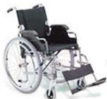
ausili anziani e disabili