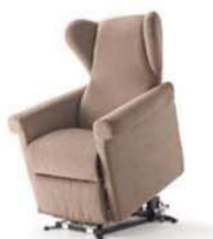
nuova linea poltrone relax made in Italy

Tecno Medica sas - INGROSSO E DETTAGLIO C.F. / P.IVA / Req. Imprese PV 02158620183 Rea PV 250291